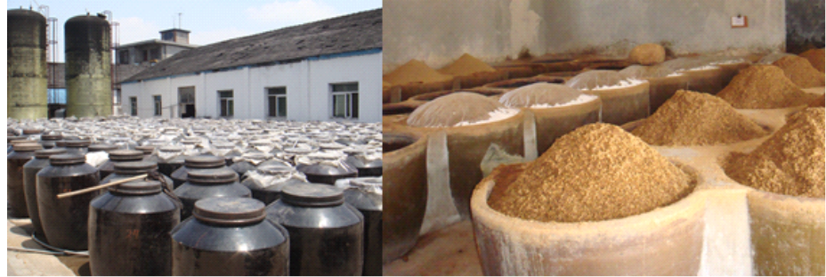
恒顺醋厂功能性微生物强化实验